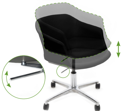
Регулировка высоты сиденья

Для комфортного пользования креслом рекомендуем настроить его перед использованием.